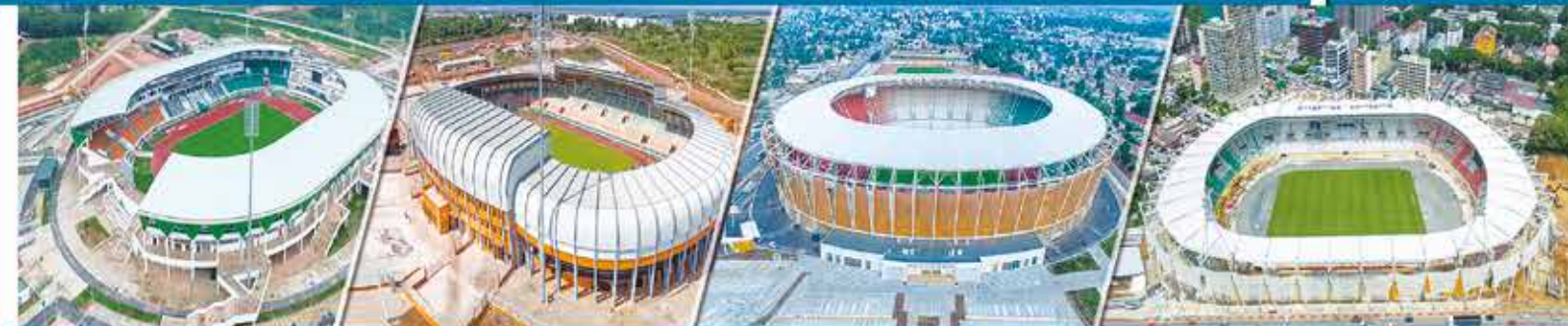
Stade Laurent POKOU SAN- PÉDRO