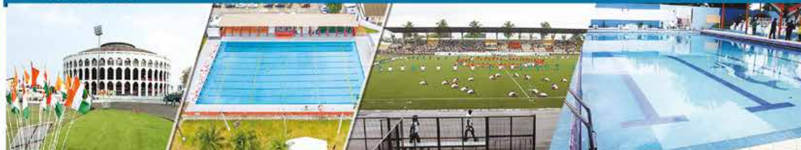
Palais des sports TREICHVILLE